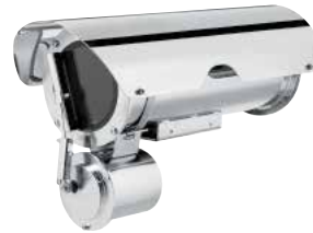
NXM36 + VIPNX