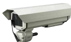
HEG + VIP6A