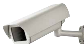
HEB + WBOVA2