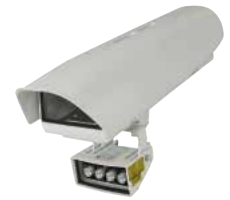
HOV + OSUPPIR + GEKO IRH