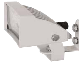
GEKO IRH LUZ BLANCA