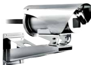
MAXIMUS MVX + NXWBS1