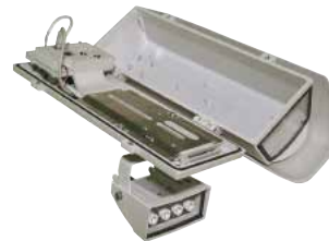
HOV HI-POE IPM + GEKO IRH