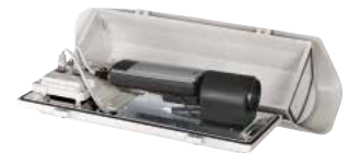
HOV HI-POE IPM + TELECAMERA